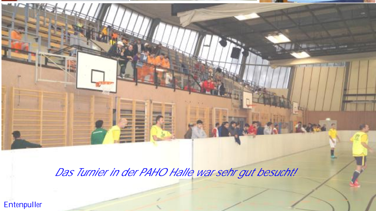
Das Turnier in der PAHO Halle war sehr gut besucht!