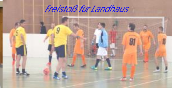
Freistoß für Landhaus