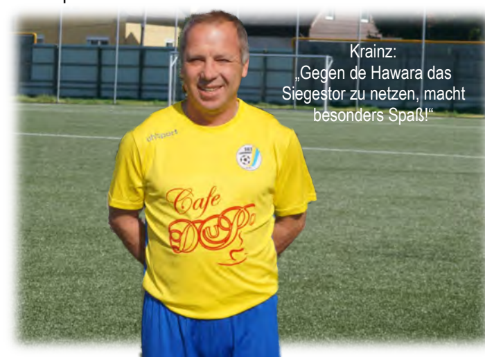
Krainz: „Gegen de Hawara das Siegstor zu netzen, macht besonders Spaß!“

Team Z war überlegen, hatte viele Chancen, aber Landhaus hatte das Glück des tüchtigen und gewann wieder ein „Big Points Spiel!“