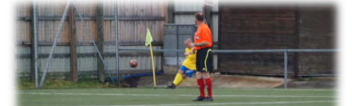
Eckball von Krainz gegen den FAC!

Führung und brachte Landhaus kurze Zeit ins wanken. Sommer Thomas rettet aber die Landhaus Ehre in den Schlussminuten mit einem Elfmeter Treffer und so wurde es noch ein gerecht geteiltes Unentschieden.