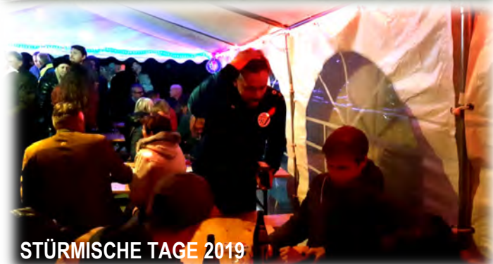
STÜRMISCHE TAGE 2019