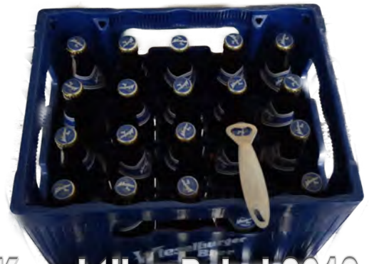
Kontaktliga Pokal 2019