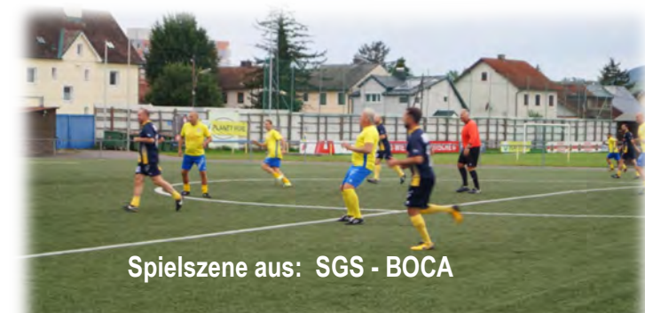
Spielszene aus: SGS - BOCA