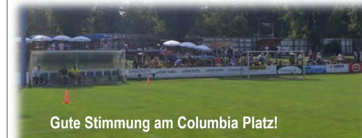
Gute Stimmung am Columbia Platz!

Ohne Niederlage, aber mit zwei Punkten Rückstand auf den Turniersieger, das war die Ausbeute für die Landhaus Senioren bei diesem sehr gut organisierten Kleinfeld Turnier. Vor Turnierbeginn verletzte sich Petersen beim Aufwärmen an der Wade und stand daher Landhaus bei diesem Event nicht mehr zur Verfügung. Gegen den FAC konnte man im ersten Spiel einen überlegenen 4:1 Sieg einfahren. Gegen Columbia musste Landhaus schon etwas mehr Kampfbereitschaft an den Tag legen und erkämpfte sich nach einem 0:1 Rückstand noch ein verdienten 1:1. Das Spiel gegen Boca stellte Landhaus vor eine fast unlösbare Aufgabe. Boca musste mit 7 Toren Unterschied geschlagen werden um noch den Turniersieg zu holen, aber man musste auch vorsichtig sein um nicht noch dritter zu werden. Es ging eigentlich nur noch um den zweiten Platz und den konnte sich Landhaus trotz vieler vergebener Chancen am Ende mit einem unrühmlichen 0:0 sichern. Am Ende musste Schönhofer Andi sogar auf der Linie retten, sonst wäre trotz Überlegenheit das Spiel beinahe verloren gegangen. Ende gut alles gut, mit dem zweiten Platz kann man Leben.