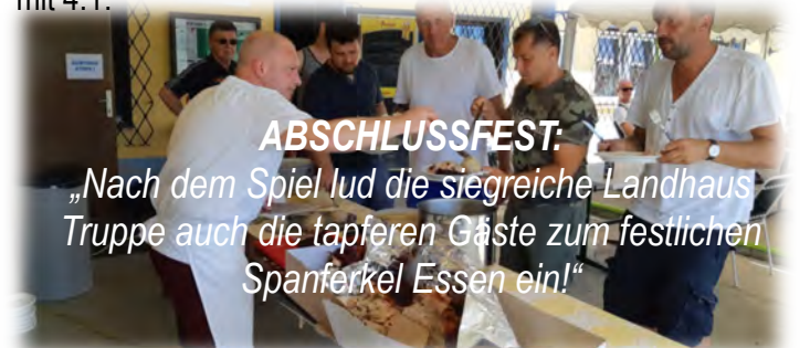
ABSCHLUSSFEST: „Nach dem Spiel lud die siegreiche Landhaus Truppe auch die tapferen Gäste zum festlichen Spanferkel Essen ein!“

Kurz vor dem Pausenpfeiff gelang Landhaus der verdiente Führungstreffer - 1:0 (40.). Auch nach der Pause kein Glück für Engie die mit zwei Stangenschüssen den Ausgleich nur knapp verfehlten. Stürmer Mandl von der SGS nimmt einen schlecht ausgeführten Abstoß vom Engie Tormann im „gegnerischen Strafraum an“ und schiebt den Ball zum 2:0 in die Maschen (nicht regulär nach der neuen Regel). Nichtsdestotrotz hatte Engie weiter sehr gute Chancen, verzeichnete weitere zwei Stangenschüsse, aber Landhaus war die glücklichere Mannschaft an diesem Tag du gewinnt das Spiel mit 4:1.