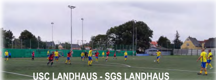
USC LANDHAUS - SGS LANDHAUS